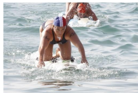
Planche de Sauvetage (Board Race)

Les sauveteurs partent de la plage et doivent nager, contourner les bouées correspondant à l'épreuve et revenir sur la plage pour franchir la ligne d'arrivée.